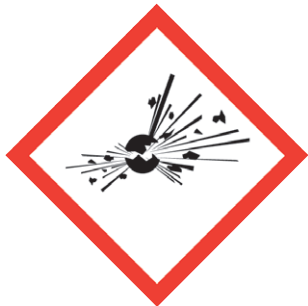
GHS01 Explodierende Bombe