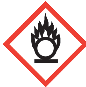
GHS03 Flamme über einem Kreis