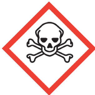
GHS 06 Totenkopf