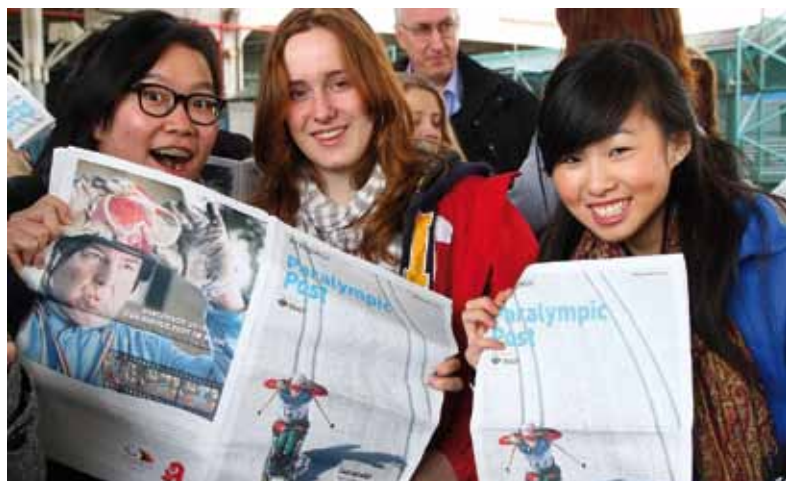
Junge Redakteurinnen halten die Paralympic Post