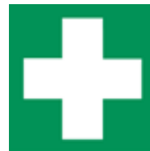
Rettungszeichen „Erste Hilfe“