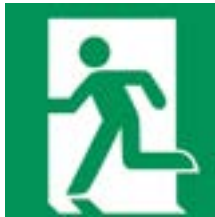
Rettungszeichen „Notausgang links“

Die Rettungszeichen-Piktogramme sind weiß und befinden sich auf einem rechteckigen, grünen Hintergrund. Sie weisen auf vorhandene Rettungswege, Rettungseinrichtungen (Erste Hilfe, Arzt) oder Rettungsmittel (Trage, Notdusche, Augenspüleinrichtung) hin.