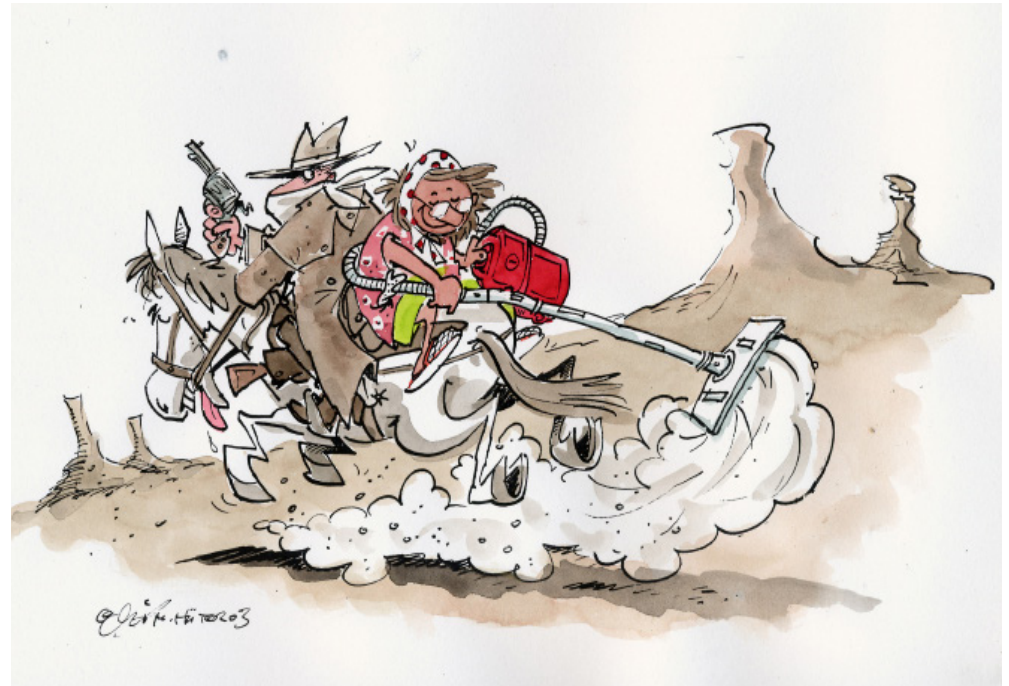
Cartoon: Michael Hütler