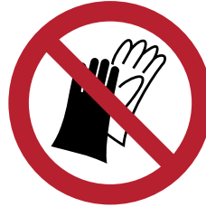
Verbotszeichen „Schutzhand- schuhe tragen verboten“

Beispiel an Bohr-, Fräs- oder Drehmaschinen. Denn Handschuhe können von Maschinen erfasst und samt Hand in sie hineingezogen werden.