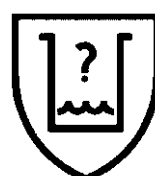
Wasser und geringe chemische Gefahren