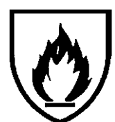
Hitze und Flammen