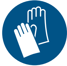
Gebotszeichen „Schutzhandschuhe tragen“