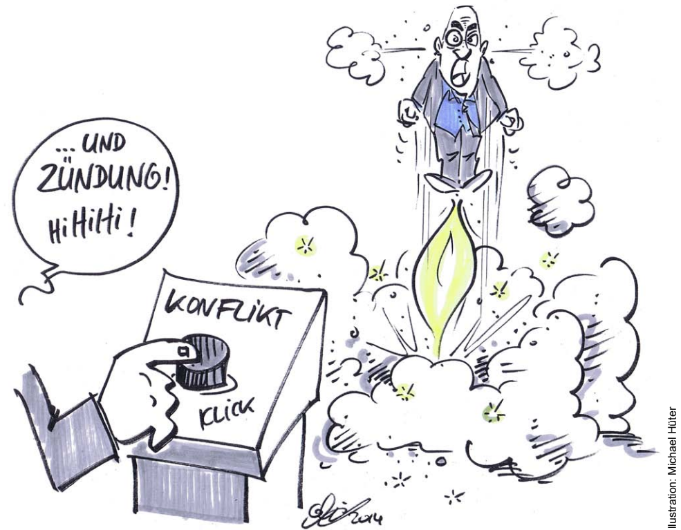
Illustration: Michael Hüter