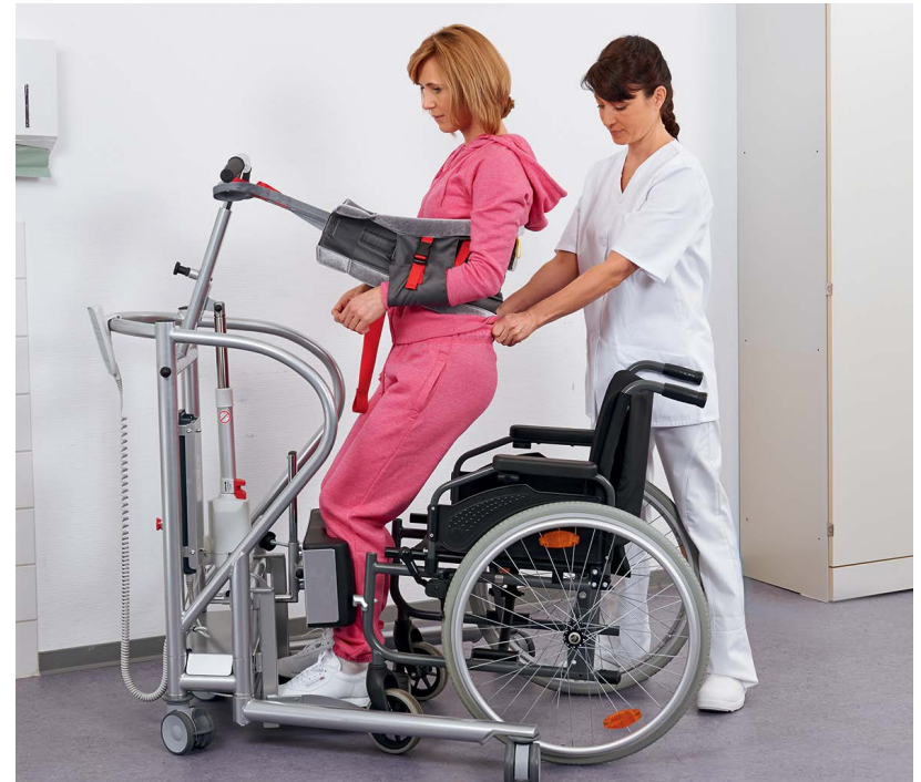
Aufsteh- oder Aufrichthilfe