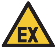
Warnung vor explosionsfähiger Atmosphäre