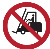
Für Flurförder- zeuge verboten