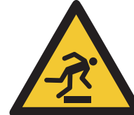
Warnung vor Hinder- nissen am Boden