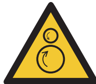
Warnung vor gegenläufigen Rollen