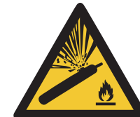
Warnung vor Gasflaschen