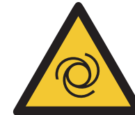
Warnung vor auto- matischem Anlauf