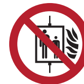
Aufzug im Brandfall nicht benutzen