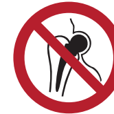
Kein Zutritt für Personen mit Implantaten aus Metall