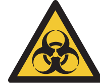
Warnung vor Biogefährdung