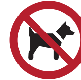
Mitführen von Hunden verboten