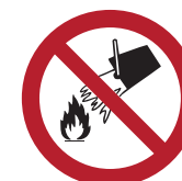
Mit Wasser löschen verboten