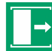
Schiebetür öffnet nach rechts*