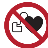
Kein Zutritt für Personen mit Herzschrittmachern oder im- plantierten Defibrillatoren sowie sonstigen aktiven Implantaten