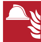
Mittel und Geräte zur Brand- bekämpfung