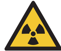
Warnung vor radioaktiven Stoffen oder ionisierenden Strahlen