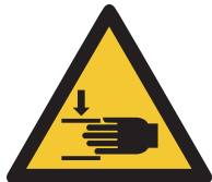
Warnung vor Handverletzungen