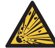
Warnung vor explosionsgefährlichen Stoffen