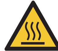
Warnung vor heißer Oberfläche