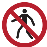
Für Fußgänger verboten