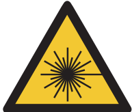
Warnung vor Laserstrahl