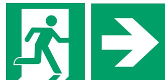
Notausgang mit Richtungsangabe