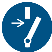
Vor Wartung oder Reparatur freischalten