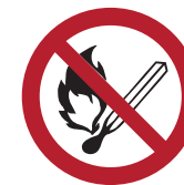
Keine offene Flamme; Feuer, offene Zündquelle und Rauchen verboten