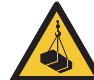
Warnung vor schwebender Last