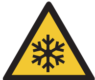
Warnung vor niedriger Temperatur/Frost