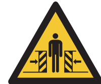
Warnung vor Quetschgefahr