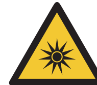
Warnung vor optischer Strahlung