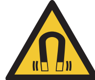
Warnung vor magnetischem Feld