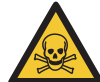
Warnung vor giftigen Stoffen