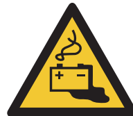
Warnung vor Gefahren durch das Aufladen von Batterien