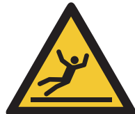
Warnung vor Rutschgefahr