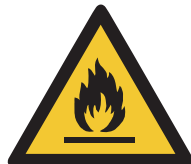
Warnung vor feuer- gefährlichen Stoffen