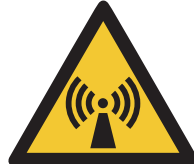
Warnung vor nicht-ionisierter Strahlung