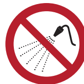
Mit Wasser spritzen verboten