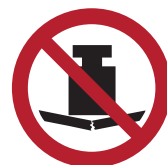
Keine schwere Last