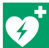
Automatisierter exter- ner Defibrillator (AED)