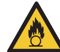
Warnung vor brandfördernden Stoffen