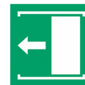
Schiebetür öffnet nach links*

* Neue Sicherheitszeichen gemäß Arbeitsstättenregel (ASR) A1.3, Stand März 2022