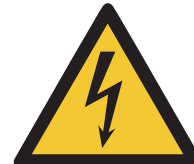
Warnung vor elektrischer Spannung