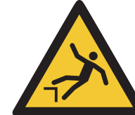
Warnung vor Absturzgefahr