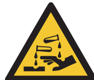
Warnung vor ätzenden Stoffen