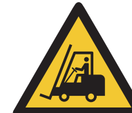
Warnung vor Flurförderzeugen