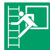
Notausstiegsfenster mit Fluchtleiter