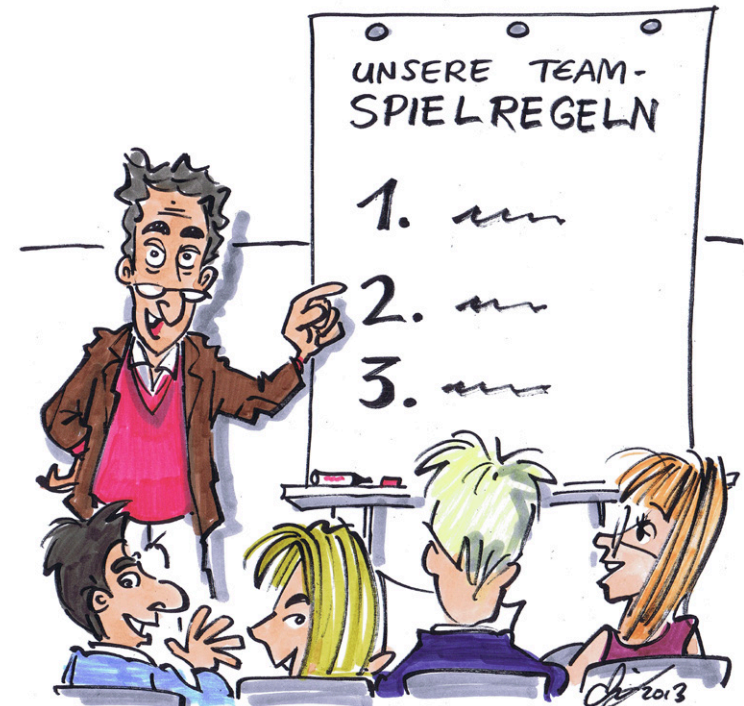
Illustration: Michael Hüter