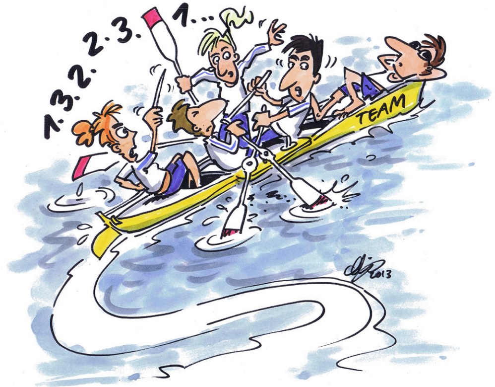
Illustration: Michael Hüter