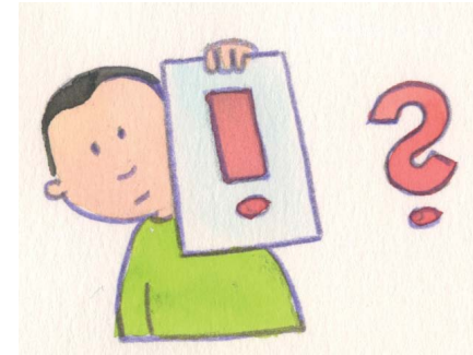
3. Welche Anliegen oder Probleme gibt es heute?