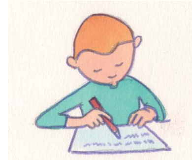
6. Wir schreiben das Ergebnis auf.