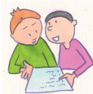
5. Wir suchen eine Lösung und einigen uns!