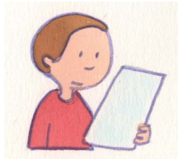
2. Was ist aus den Ergebnissen vom letzten Mal geworden?