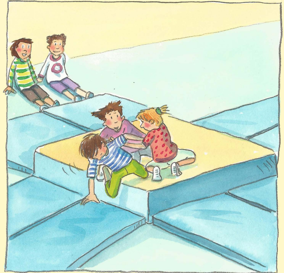
Illustration: Dorothea Tust

Die Kämpfenden knien entweder oder sind in Bankstellung. Jeder versucht nun, die anderen Kinder auf die Turnmatten zu drängen und so die „Burg“ für sich in Besitz zu nehmen. Wer am Schluss übrig bleibt, ist Mattenkönig oder Mattenkönigin.