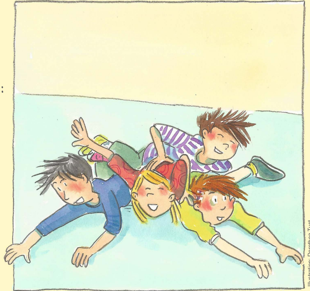
Illustration: Dorothea Tust