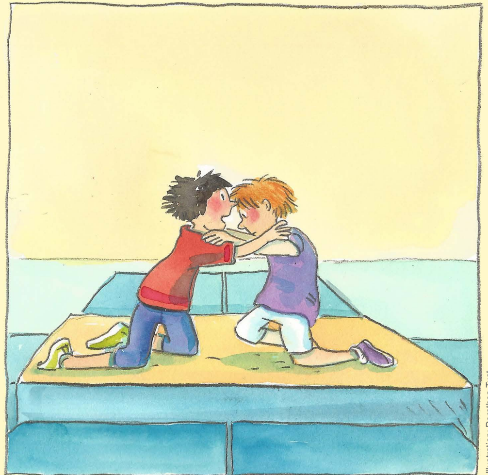
Illustration: Dorothea Tust

Bei diesem Spiel kämpfen jeweils zwei Kinder, die anderen sehen ihnen zu. Der Zweikampf findet auf einer großen Matte statt, um die herum viele kleine Turnmatten liegen. Gekämpft wird im Knien. Ziel dabei ist es, sein Gegenüber aus dem Spielfeld zu schieben.