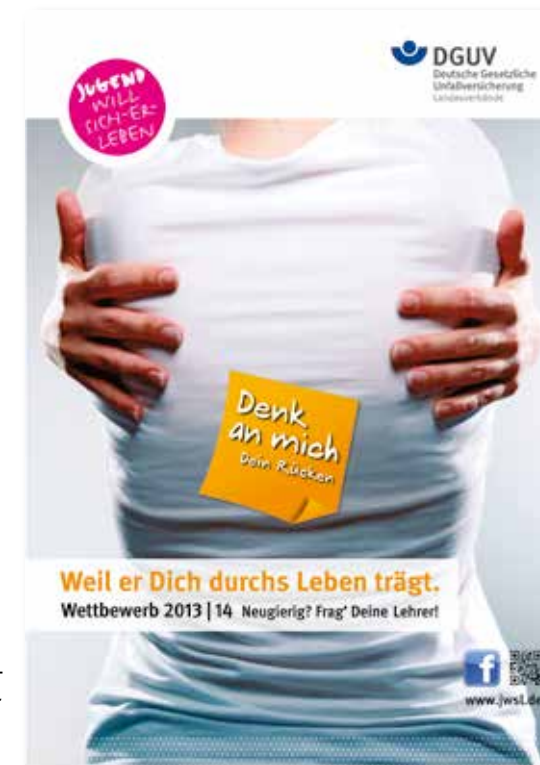
Plakat der DGVU-Kampagne „Denk an mich. Dein Rücken“

Weitere Informationen unter www.jwsl.de und www.deinruecken.de