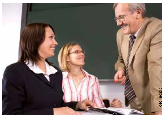
Schulleiterinnen und Schulleiter sind bei der Umsetzung von Inklusion besonders gefordert.

Vermutet werden können unter anderem besondere Beanspruchungen durch zusätzliche Organisationspflichten (Ausbau von Kooperationsstrukturen), vermehrte didaktisch-methodische Planung (innere Differenzierung