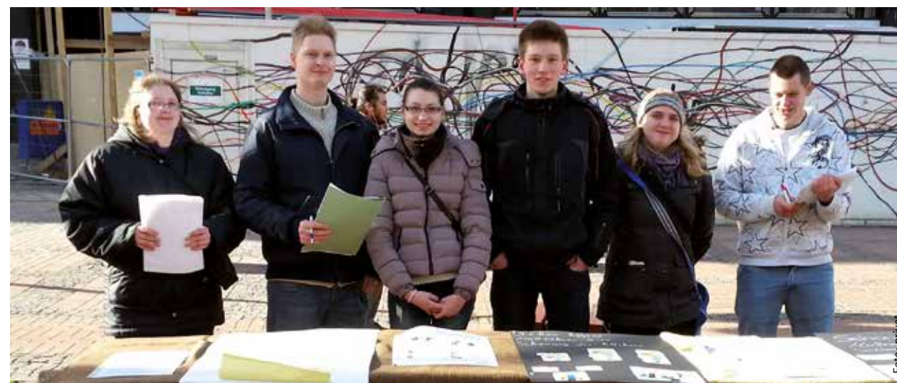
In der Dortmunder Innenstadt informierten Schülerinnen und Schüler des Berufskollegs am Eichholz zum Thema Rückengesundheit.